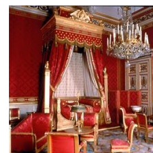
Chambre de l'empereur