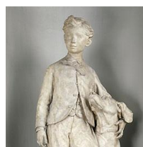
Le prince impérial