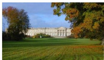
Château et parc

Napoléon rencontre à Compiègne sa future épouse, l'archiduchesse Marie-Louise d'Autriche, pour la première fois le 27 mars 1810. L'an suivant le roi de Rome les y accompagne. C'est encore à Compiègne que Napoléon III rencontre et fait la cour à Eugénie de Montijo. Il lui offre une broche en diamants et émeraudes parce qu'elle a admiré les gouttes de rosée sur des feuilles de trèfle du parc !