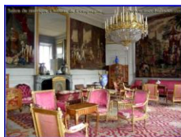
salon de musique